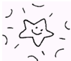
Twinkle Twinkle Little Star