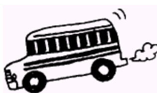
The Wheels On The Bus